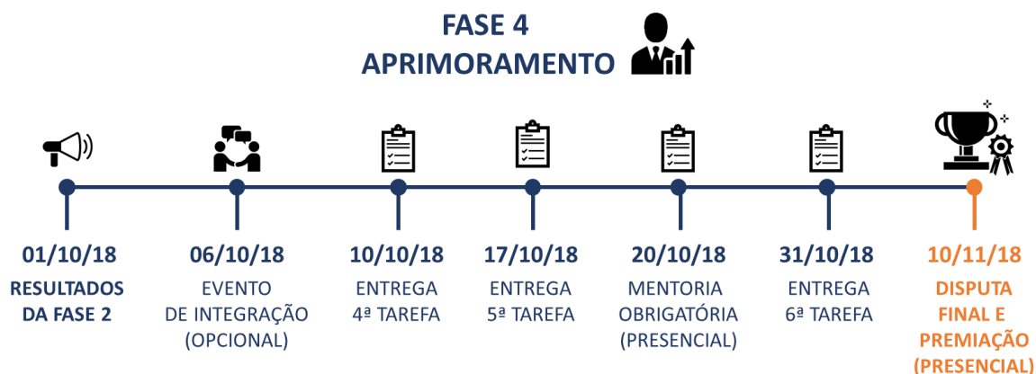
Figura 3 - Atividades relativas à Fase 4 – Aprimoramento do ITA Challenge 2018.

Durante toda a Fase 4, tarefas relacionadas a viabilidade econômica do negócio serão lançadas periodicamente e suas entregas deverão ocorrer conforme as datas-limite indicadas na Figura 3.